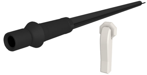
图片可能与所选产品不完全一致