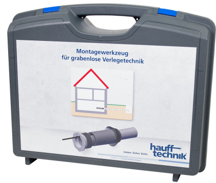
Monteringslåda MIS NoDig