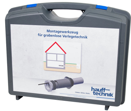
Monteringslåda MIS NoDig