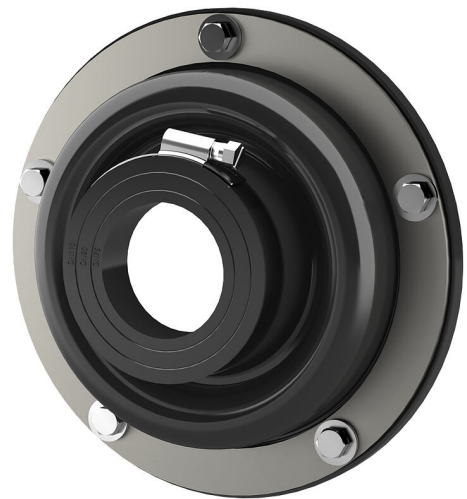
Bilden kan avvika från den valda produkten

För pluggning av kärnboringar, öppningar eller foderrör på väggar eller före ursparningar i plåthöljen. Beroende på systemet inkorporeras den befintliga källartätningen fackmannamässigt utan omständlig efterbearbetning. Samtidigt tätas samma komponent direkt det genomförda mediaröret.