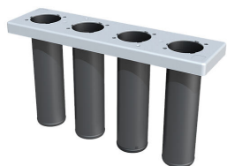
Tesnilni vložek za sestavni del gradnje v začetni fazi