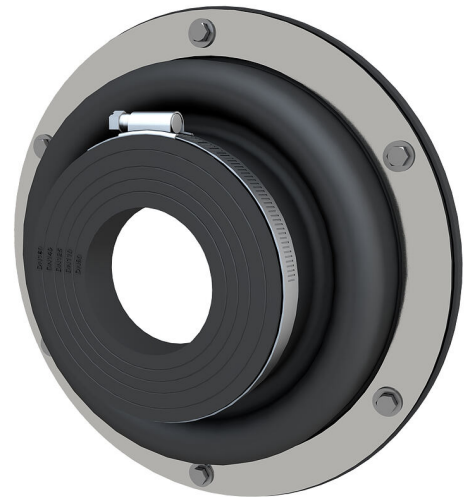
Slika se lahko razlikuje od izbranega izdelka

Za privijanje z vijaki in vložki na izvrtine, preboje ali cevne uvodnice na stenah ali privijanje pred vdolbinami v pločevinastih ohišjih. Odvisno od sistema je mogoče manšeto strokovno povezati z obstoječo zatesnitvijo kleti brez obsežnega naknadnega dela. Z istim delom se hkrati izvede zatesnitev vanj vstavljene cevi za medij.