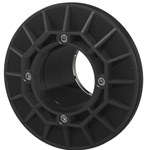
Slika se lahko razlikuje od izbranega izdelka

Gumijasto tesnilo s prekrivno prirobnico iz nerjavnega jekla za vključitev v obstoječo zatesnitev stavbe s kletjo. S tesnilno širino 80 mm je primerno za zatesnitev v izvrtinah v dvojnih/elementnih stenah. Enota 6.2 zatesni tako betonski opaž dvojne/elementne stene kot tudi beton na kraju vgradnje. S tem je preprečeno vdiranje kapilarne vode med elementno steno in betonom v izvrtino.