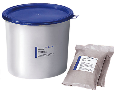
Malta za zalivanje Hauff-Beto-Fix