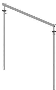
Naprava za postavljanje