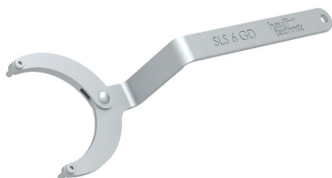
Ključ s čelnima zatičema