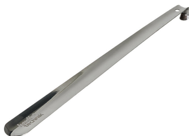
Montažna pločevina za protipožarno blazino