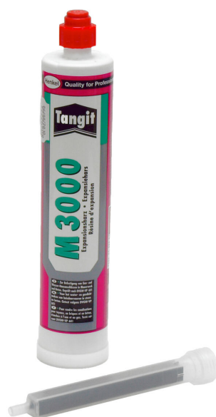
2-komponentna smola M3000