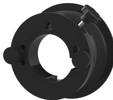
Hitrovpensjalna naprava MIS