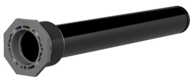
Osnovna izvedba z notranjo zatesnitvijo