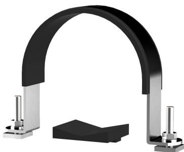
Lok za pritrdjevanje