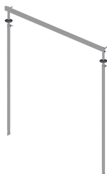
Naprava za postavljanje