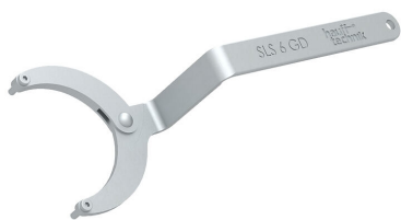
Klucz do pokryw