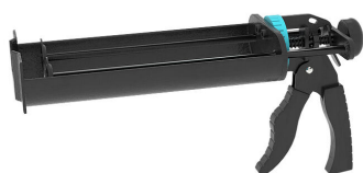
Pistolet na wkłady