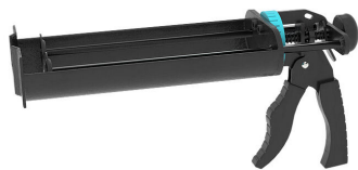
Pistolet na wkłady