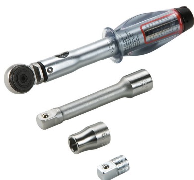
Zestaw narzędzi do montażu pokrywy KES-M