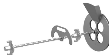
Urządzenie do wypełniania