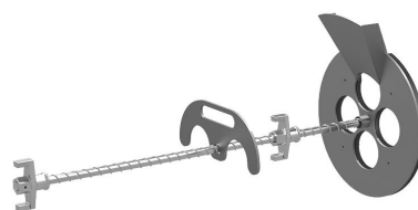
Urządzenie do wypełniania