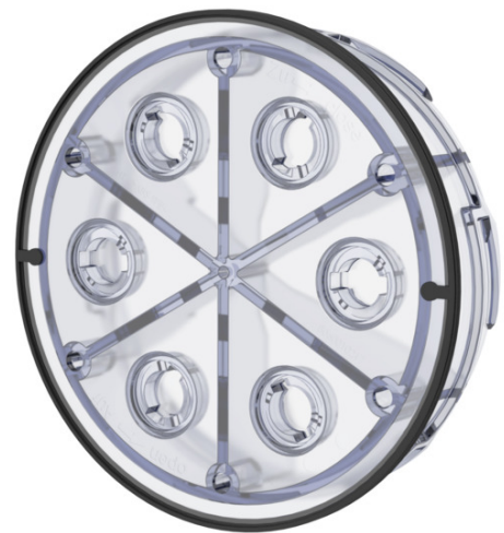
Zdjęcie może się różnić od wybranego produktu

Do wodo i gazoszczelnego zamykania niewykorzystanych przepustów kablowych lub flansz z tworzywa sztucznego systemu HSI 150.