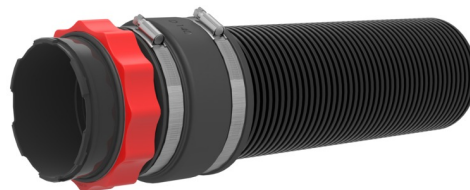
Zdjęcie może się różnić od wybranego produktu

Do zastosowania w przepustach kablowych lub flansza z tworzywa sztucznego HSI 150. Do przyłączenia karbowanych rur osłonowych. Uszczelnienie wykonuje się przy użyciu techniki mankietów uszczelniających – gumowy mankiet jest mocowany na pokrywie systemowej i rurze osłonowej za pomocą opasek zaciskowych. Do przyłączenia rury karbowanej dodoawane są dodatkowo pierścienie wzmacniające, które usztywniają rurę osłonową.