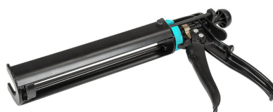
Pistolet na wkłady