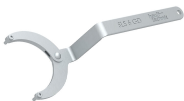
Klucz do pokryw