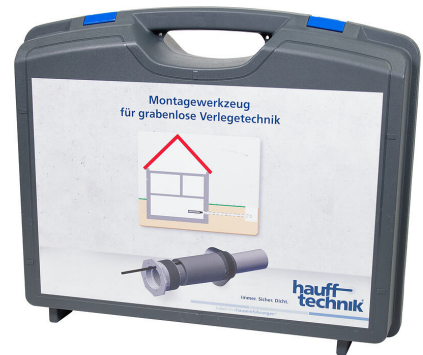
Montagekoffer MIS NoDig