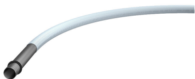
Sistema di tubi a spirale