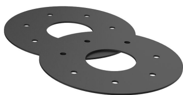
Inserti in gomma