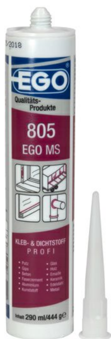
Massa sigillante EGO