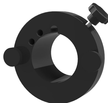
Dispositivo di serraggio rapido