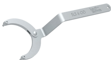
Chiave a bussola snodabile