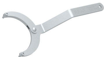
Chiave a bussola snodabile