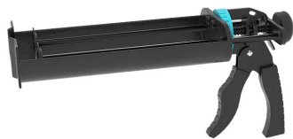
Pistola per cartucce