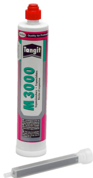
M3000 2 komponensű gyanta