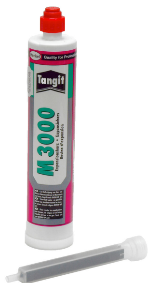
M3000 2 komponensű gyanta