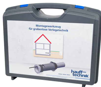
Kutija za montažu MIS NoDig