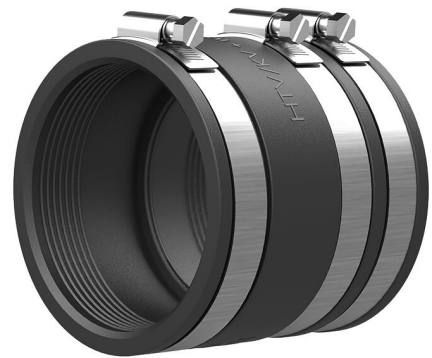
Slika može odstupati od odabranog proizvoda

Manžeta za montažu vodovodnog voda na kraju spiralnog crijeva Hateflex 14110. U spoju s izmjenjivim umetkom WE 125-z/d vod se može brtviti gumenom pritisnom tehnologijom.