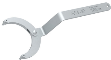
Zglobni ključ za matice s dvije rupe