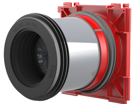
Slika može odstupati od odabranog proizvoda

Za jednostrani priključak sistemskih brtvi za kabele (s unutarnje strane) i za priključak kabelskih zaštitnih cijevi (s vanjske strane).