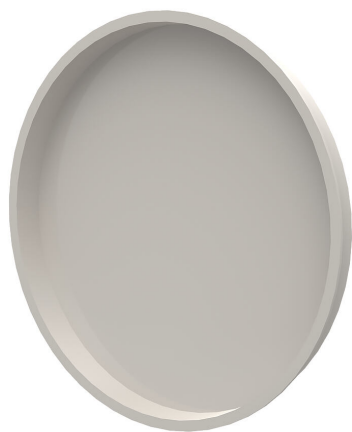
Poklopac od polietilena