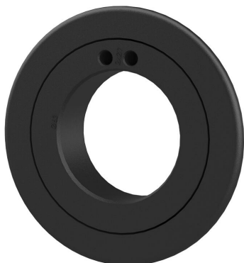
Rozeta za završetak zida