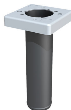
Brtveni umetak za osnovni umetak