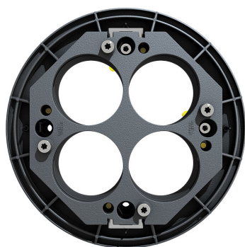
Gaine paquet de maître d'œuvre ETGAR