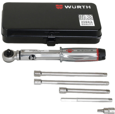
Kit d'assemblage pour HSI150 DG/HRK SSG