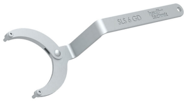
Clé articulée à ergots