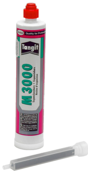
Résine bicomposant M3000