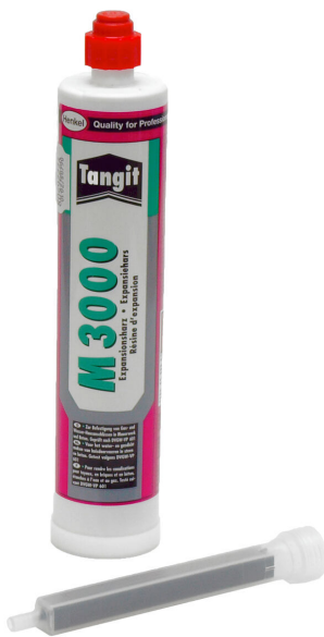
Résine bicomposant M3000