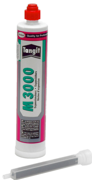
Résine bicomposant M3000