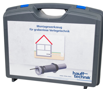
Coffret d'installation MIS NoDig