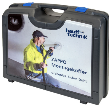
Coffret d'installation ZAPPO