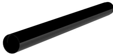
Tuyau de creusement ZAPPO