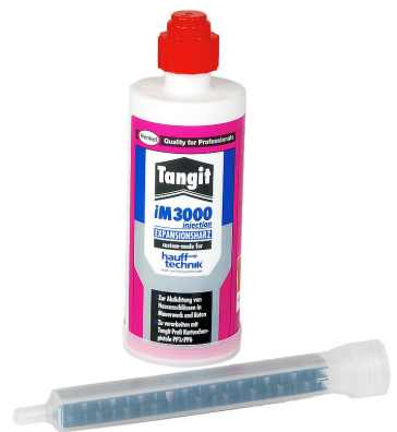
Résine bicomposant iM3000