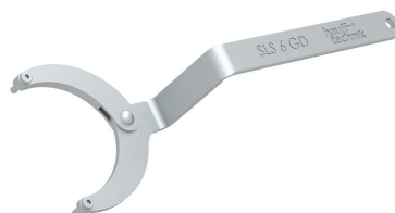
Clé articulée à ergots