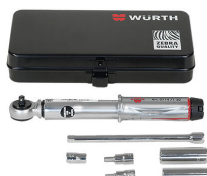
Jeu d'outils universel